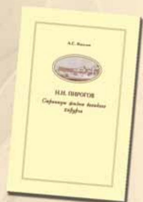
Издания к 200-летию со дня рождения Н.И. Пирогова